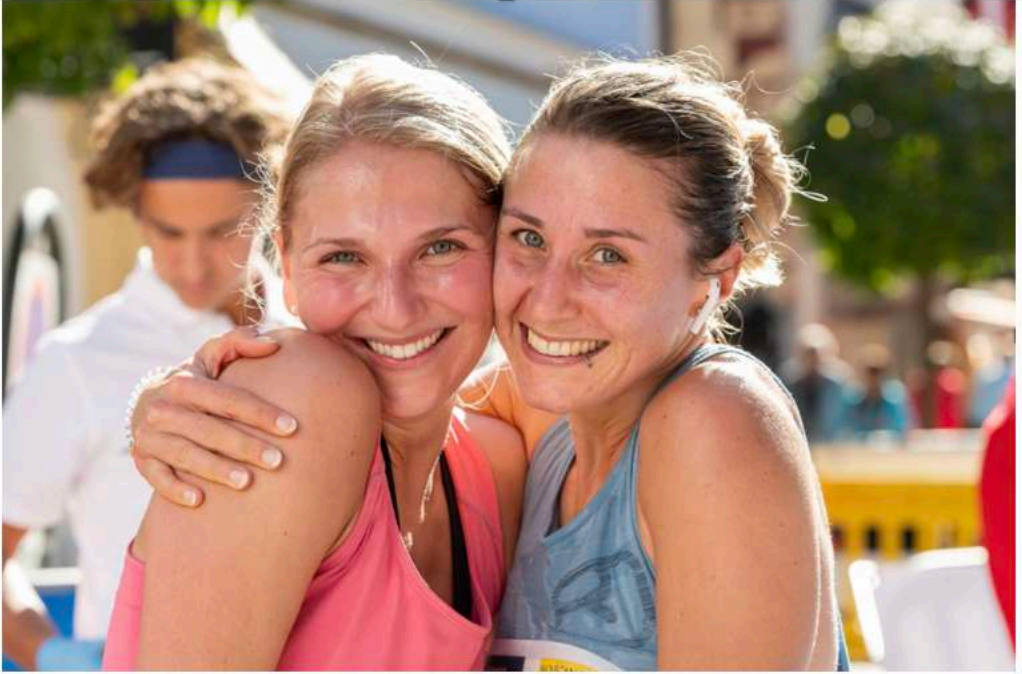
Bild: Laufen am Wolfgangsee macht glücklich!